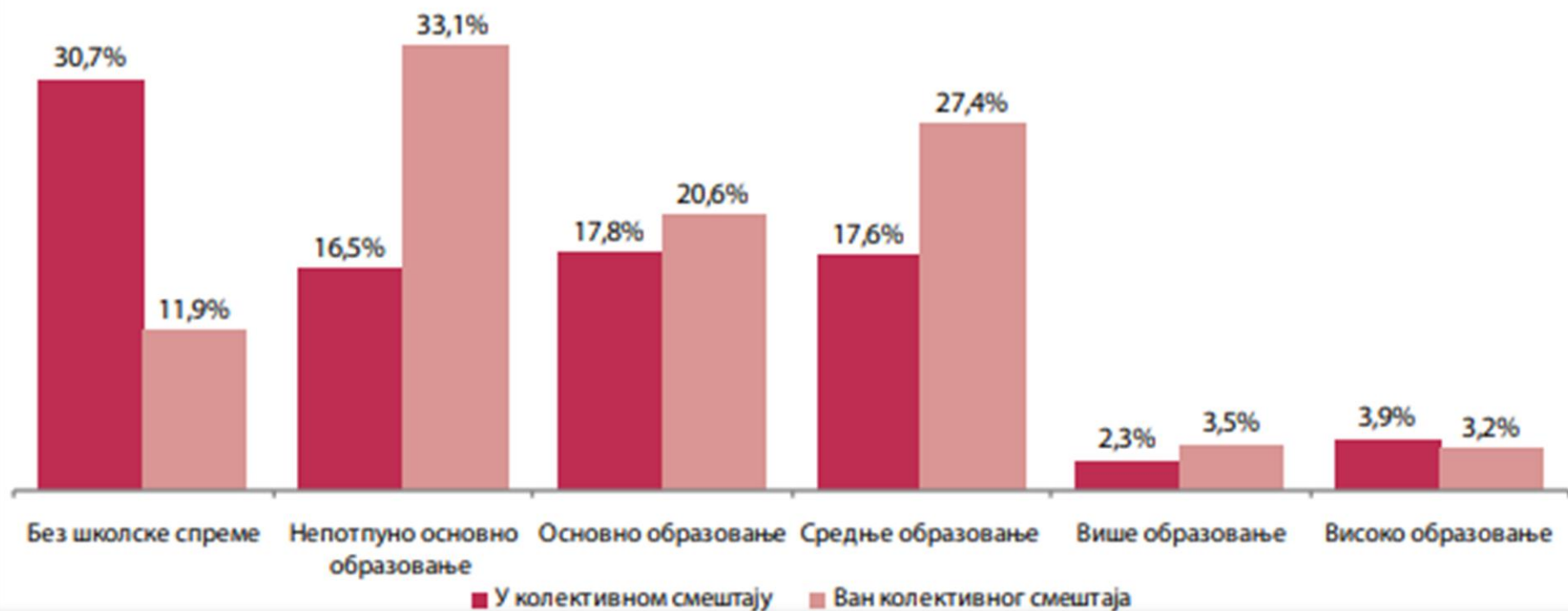
Графикон 33. Особе са инвалидитетом према степену образовања, у установама колективног смештаја и ван њих, Република Србија, Попис 2011.